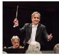
Bacchetta Direttore d'orchestra Conlon

N on andrà perduta neppure una nota. Il Natale 2018 sarà ricordato per l'edizione integrale dello Schiaccianoci, l'incanto della favola e la potente magia della musica di Cajkovskij, la ricchezza straripante della sua fantasia, senza nessuna riduzione. E sarà sufficiente l'Orchestra Rai e James Conlon per dare vita al giocattolo di legno che trascina la piccola Clara alla scoperta della vita e del mondo intorno a sé. Musica che sprigiona paura e grande passione, senza ballerini e coreografie, stupore e meraviglia senza