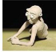
Animazione Framed in stop motion

A rriva l'inverno e, come da tradizione, il cinema d'autore si veste in corto. Il 21 dicembre, fin dal 2010, è la giornata dedicata alla cinematografia breve, ma non per questo meno intrigante. Diffusa in cinquanta nazioni nel mondo, e organizzata in Italia dal Centro Nazionale del Cortometraggio, la ricorrenza è occasione privilegiata per programmare quelle opere che, durante l'anno, difficilmente esulano dai circuiti festivalieri. La selezione di questa edizione consiste in un focus sulla