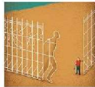
Opera Uno dei 150 lavori in mostra