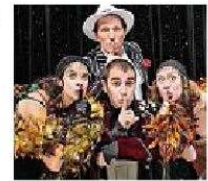
«Spikis!» Lo show firmato Brachetti