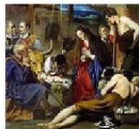
Dipinto Da San Pietroburgo a Torino

J uan Bautista Maino (1580-1649), definito «caravaggista freddo», è stato un protagonista del grande Barocco spagnolo, forse allievo di El Greco, sicuramente attento alle novità stilistiche portate in Europa dai Carracci e da Guido Reni. A questa grande tradizione rende omaggio dal 22 dicembre al 6 gennaio il Grattacielo Intesa Sanpaolo (corso Inghilterra 3) accogliendo, nell'ambito del progetto «L'ospite illustre», l'«Adorazione dei pastori», olio su tela dipinto da Maino non prima del 1613 e dal 1814 conservato