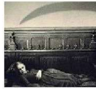
Frame La pellicola del regista danese